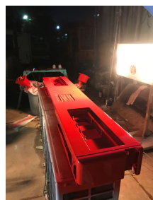
ゆがんだ場所を補正し、パテ埋め。塗装。