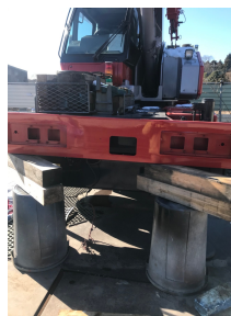
パーツも色を合わせる為に、丁寧に塗装。